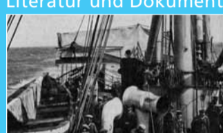
Truppentransport auf Woermann-Dampfer (1904).

Literatur und Dokumente zum deutschen Kolonialismus