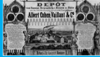
Werbeblatt der späteren Phoenix-Werke (um 1862).

Kolonialwaren von der Süderelbe – Postkoloniale Hafenrundfahrt zwischen Harburger Binnenhafen, Altenwerder und Wilhelmsburg